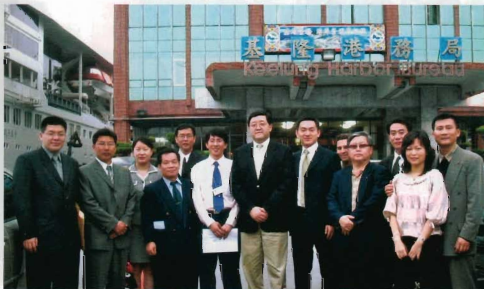
考察團成員與基隆港務局負責人合影。

確的意向。目前，考察團成員正在對一次的考察行程進行醞釀，歡迎有共同的華商共襄盛舉。