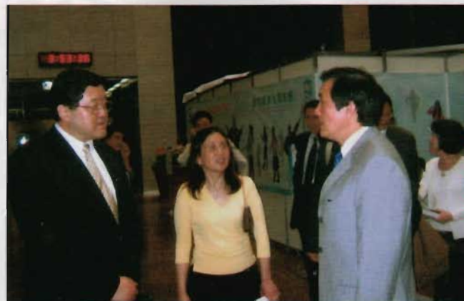
馬英九市長歡迎考察團成員到訪。

團來訪表示歡迎，并向考察團成員介紹了陝西省的投資環境和投資政策。他說，西部大開發以來，陝西進一步基礎設施和生態環境的建設力度，環境得到了很大改善。陝西有著