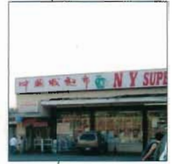
New York Supermarket Group