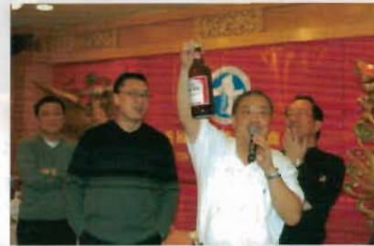
男士們比賽喝啤酒。