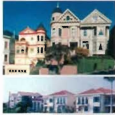
Dragon Development LLC.