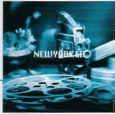
NY Int'l. TV & Media USA Inc.

Tel: 718-628-6200 Toll Free: 1877-357-6668 www.strongltd.com 2-39 54th Avenue Long Island City, NY 11101