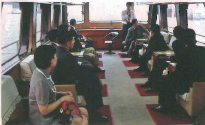
乘船參觀基隆港口。

自然資源和旅遊資源，雄厚的科教實力和工業基礎，近几年來經濟增速持續保持10%以上。希望各位朋友能在了解陝西的基礎上，介紹更多的商界朋友來陝西參觀、考察、投資，使雙方的交流與合作得到進一步加強。西安市副市長朱智生在會見考察團員時介紹說，西安既是一座人文之都，也是現代科教和科技之城；西安有高新技術產業開發區、經濟技術開發區和航空產業基地三個國家級開發區，裝備製造業有良好的工業基礎和豐富的人力資源；西安市連續14年經濟呈兩位數增長。劉建邦會長代表總商會感謝陝西省領導和西安市領導的熱情接待，是西部大開發以來陝西省取得的成就，吸引總商會的華商來陝考察，尋找商機，為在美華人搭起通商和投資的橋樑。在結束西安、烏魯木齊之行後，部分考察團成員來到成都，就在成都市投資“美國中小企業園”與政府有