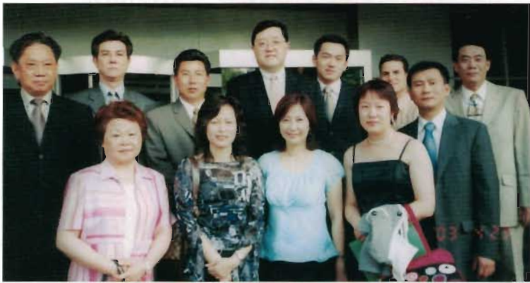
考察團成員在考察西安市時合影。