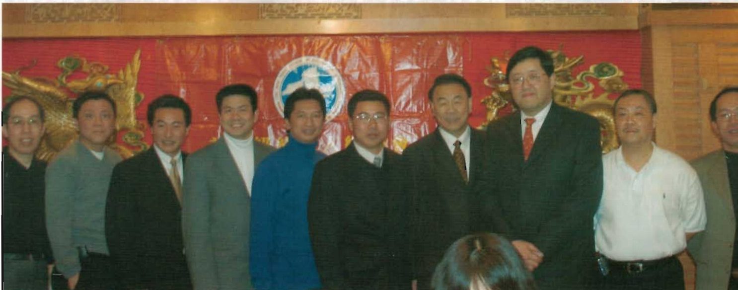
常務理事們在晚會上與州議員孟廣瑞合影。