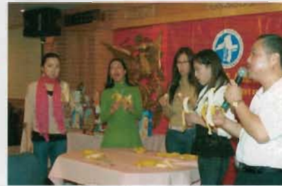
女士們比賽吃香蕉。