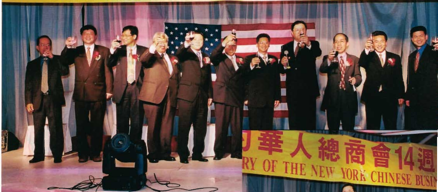
全體常務理事向來賓敬酒。