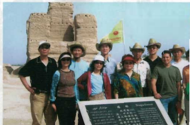
考察團成員在遊覽新疆吐魯番土城時合影