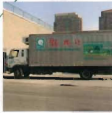
US Wide Delivery