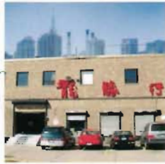
Strong America Ltd.