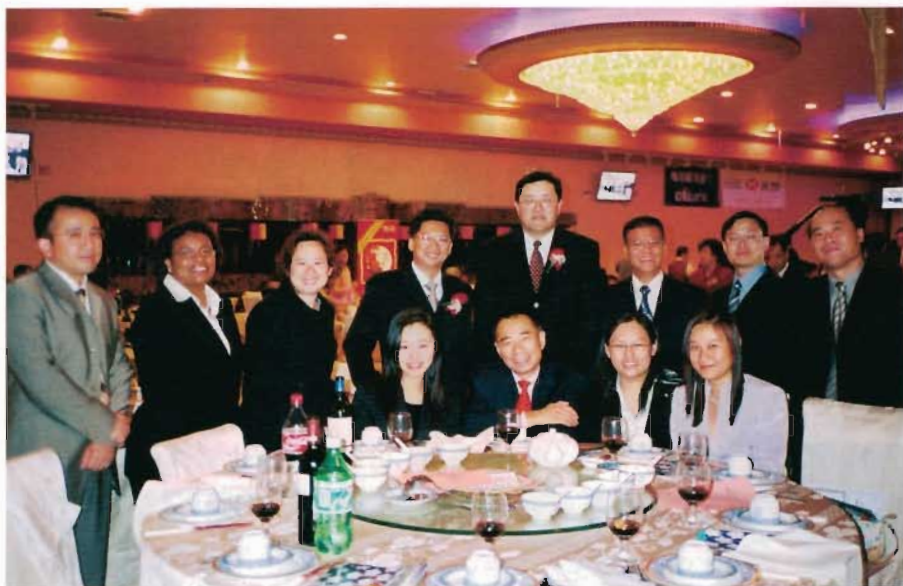
劉會長、大會主席翁晉意與贊助商匯豐銀行同仁合影。