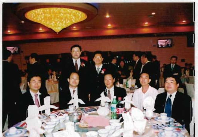
劉會長、大會主席翁晉意與贊助商 花旗銀行同仁合影。