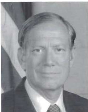
GEORGE E. PATAKI GOVERNOR