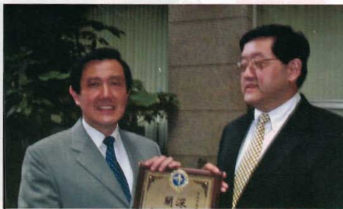
劉建邦會長贈送獎牌與馬英九市長，表彰他的勤政愛民。