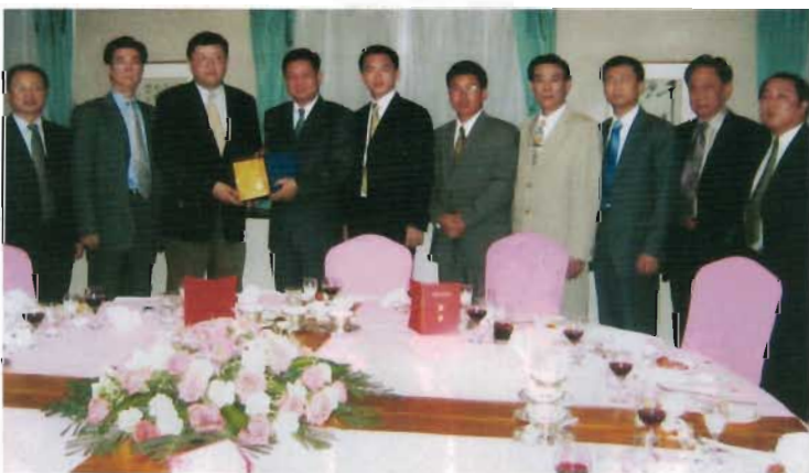
趙正永副省長贈送考察團禮物並合影留念。