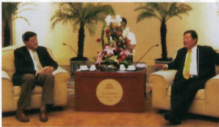
劉建邦會長與西安市副市長朱智生親切交談。