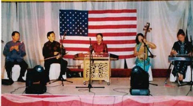
中樂演奏民族樂曲。