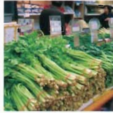
Fresh Vegetable and Fruits