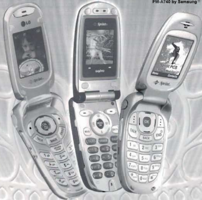
Sprint PCS Vision™ Picture Phone PM-A740 by Samsung®