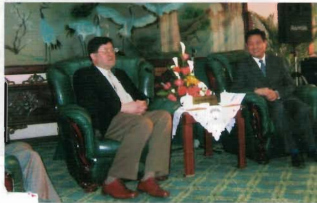
劉建邦會長與陝西省常務副省長趙正永親切交談。